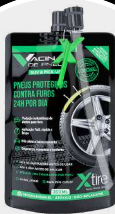
SUV & PICK-UP